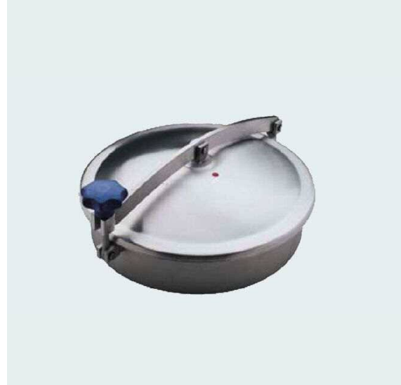
図1 - LKDSの外形

LKDCのパッキンは取り換え可能です。ダブルリップシール構造で、例えばタンク自動洗浄用ノズルの噴流や、可搬式のタンクやタンクローリーの液面の揺れによる飛沫を外部に漏らさないようにシールします。